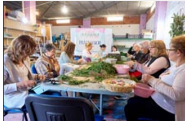
Portal Praza Maior 3