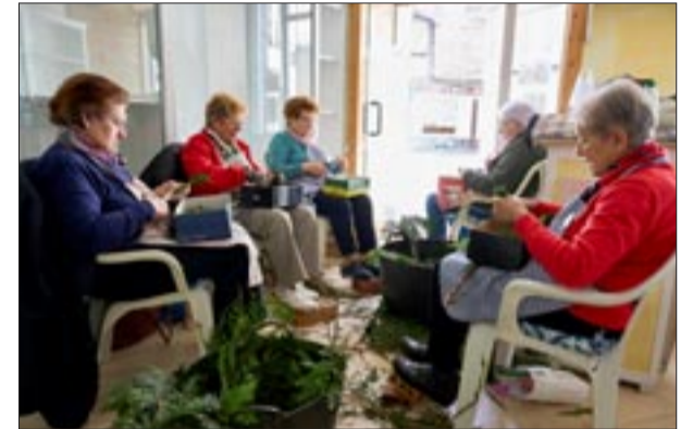
Portal Praza Maior