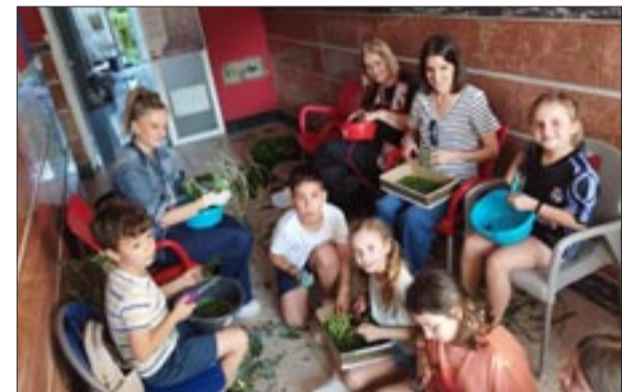
Portal Praza Bugallal