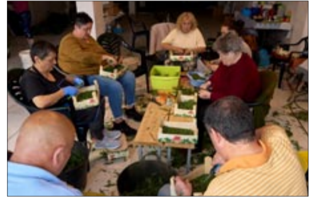
Portal Fonte do Baratillo