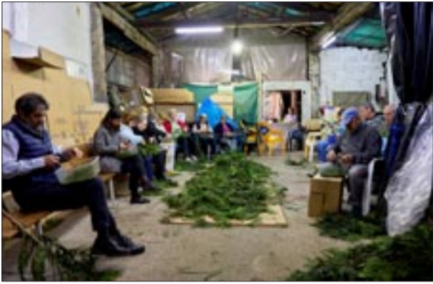
Portal Reveriano Soutullo