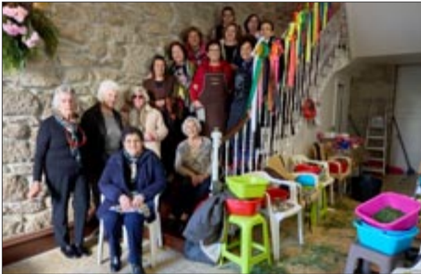
Portal Praza Maior 2