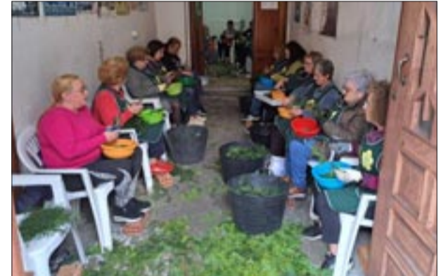
Portal Elduayen - La Giralda 2