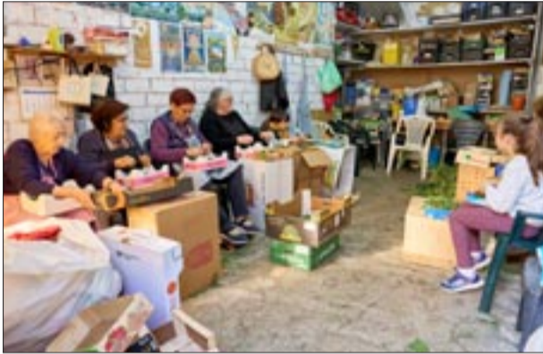
Portal Ferreiros - San Roque