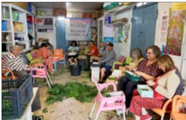
Portal Fernández de la Vega