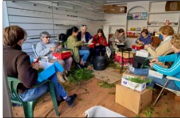
Portal Rúa de Oriente 1