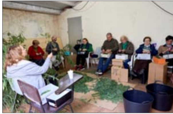
Portal A Castiñeira