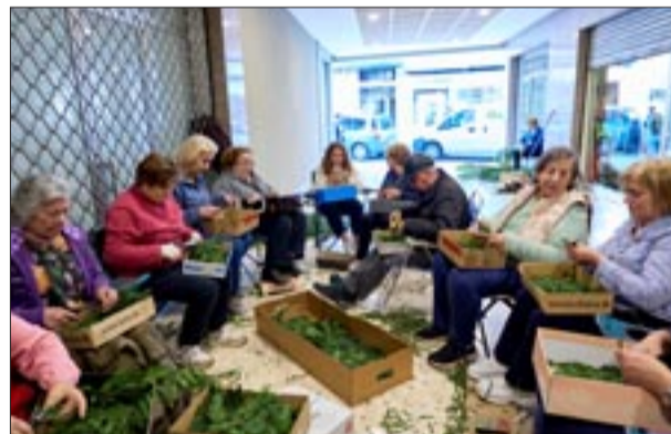
Portal Cantón de Boavista