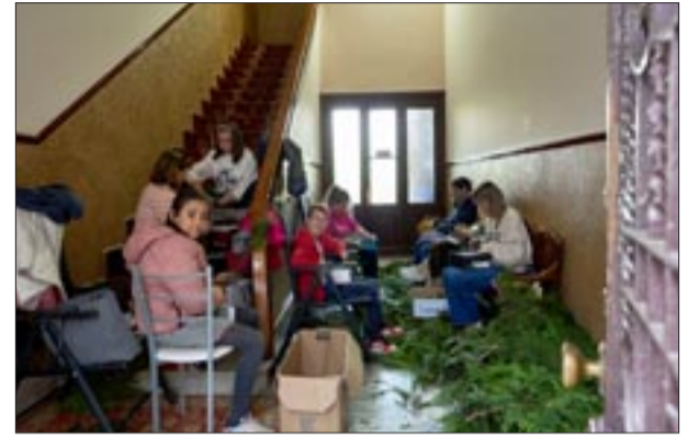
Portal Rúa de Oriente