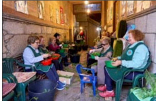
Portal Elduayen - La Giralda 1