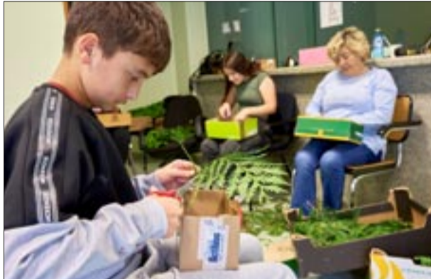
Portal Arco da Vella