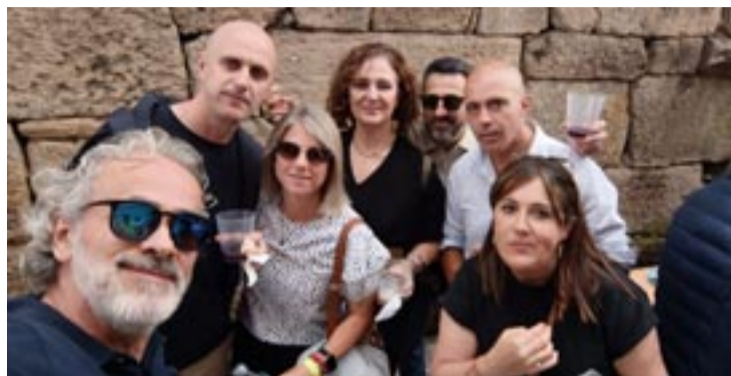
O Roteiro dos Fornos cada vez ten máis aceptación.