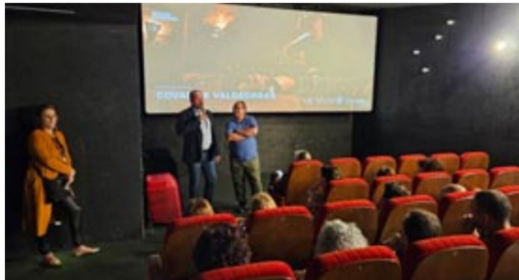
O acto celebrouse na sala NUMAX, en Santiago de Compostela.