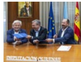
Sinatura do convenio na Deputación.