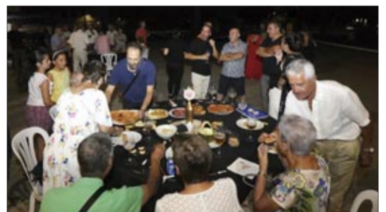
Mesa da cea na Feira Vella.