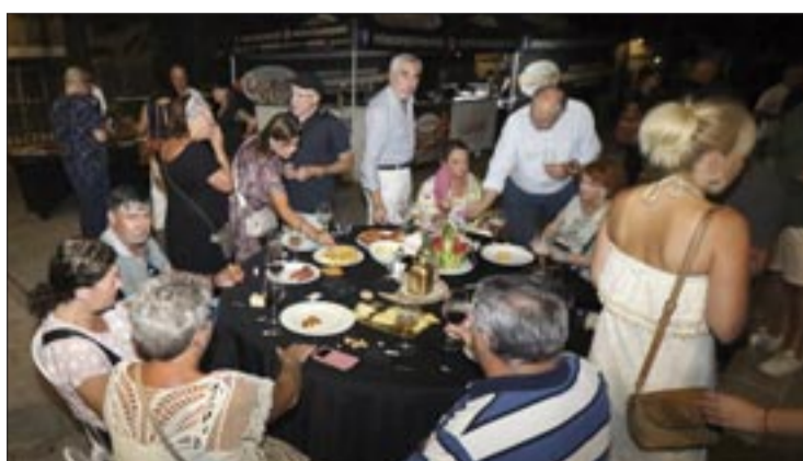
Cea na Feira Vella.