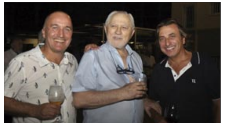
Con antigos alumnos de Leirado.