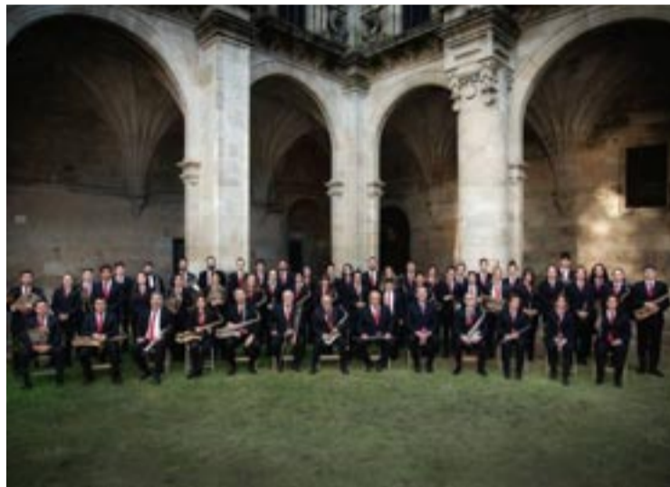
Banda de música de Celanova.

O venres día 20 de madrugada haberá gran folión pirotécnico e verbena amenizada por Mucho más allá e Aqua Music. O sábado 21 ás dez da mañá partidos de alevín F8 e alevín F8 B de Cea