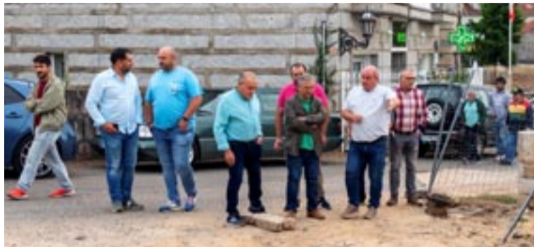
Estado actual das obras provinciais en Laza.

Menor comprobou as obras que está a executar o Concello para a restauración do muro de contención entre a rúa Zapateiros e a praza da Picota, cun investimento de 30.000 euros. Tamén visitou o acceso ao patio de manobras da base do GES (38.000 euros) e á cuberta da pista de pádel (42.642,17 euros), así