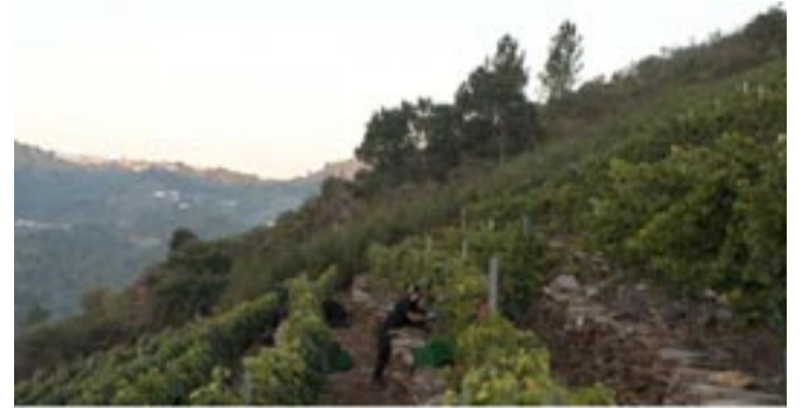
Vendima en Adegas Vella. (Abeleda. A Teixeira) na subzona de Ribeiras do Sil.

O pleno do Consello Regulador da denominación de orixe Ribeira Sacra decidiu como data oficial para iniciar a campaña da vendima 2024 o día 23 de setembro. Para iso, téñense en conta os datos dos controis de maduración que técnicas do Consello Regulador realizaron en parcelas representativas das cinco subzonas da denominación (Amandi, Chantada, Ribeiras do Sil, Ribeiras do Miño e Quiroga-Bibe) e con todas as variedades de uva acollidas á mesma. Os primeiros controis de maduración iniciáronse o día 26 de agosto. O pasado ano a data oficial foi o 14 de setembro, finalizando a ven-