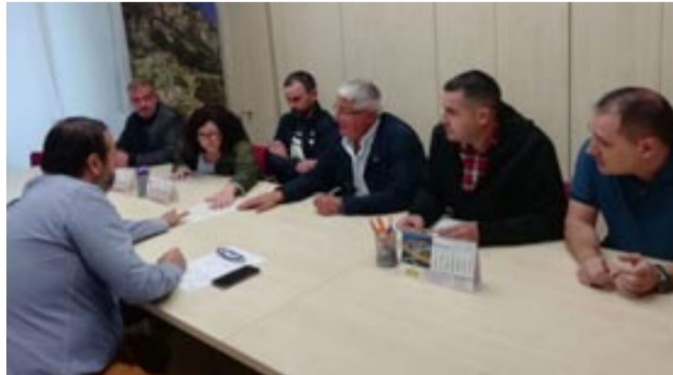
Xuntanza do Sindicato Labrego Galego en Monforte.

O Sindicato Labrego Galego (SLG) considera insuficientes as