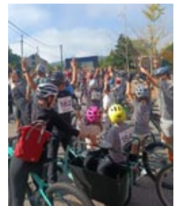
Saída do percorrido.

O percorrido foi desde a capitalidade ao encoro de Cachamuña e optouse por evitar a pasarela e gañar en accesibilidade. A edición disto ano chegou con novidades, entre outras un concurso fotográfico, o sorteo de agasallos entre os participantes e a animación e presentación da proba. "Fomentar o deporte, incentivar o contacto coa natureza e apostar pola convivencia cidadá son os obxectivos nos que incide esta actividade na que cada ano