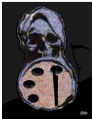
A un tic do tac