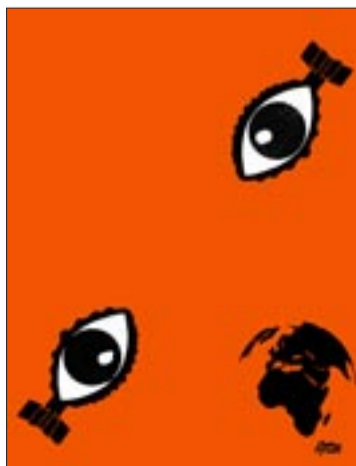
ollo por ollo e xente por xente