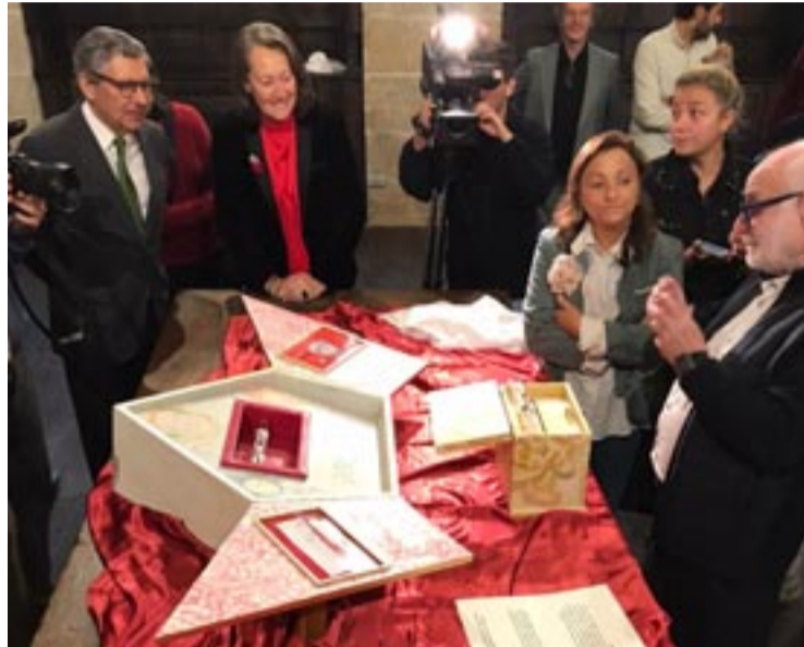
Aneis que pertenceron ós Bispos Santos enterrados no mosteiro de Santo Estevo de Ribas de Sil.