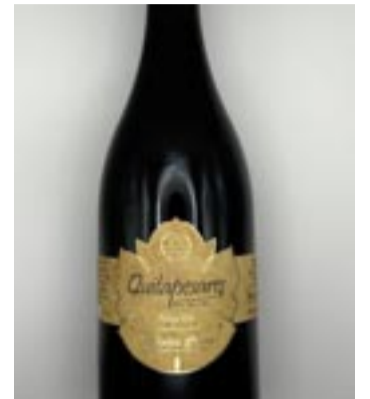
Quitapesares. Mencía de Adegas Vella, Gran Medalla de Ouro.

Gran Medalla de Ouro: Godello Pazo da Meiga 2023 de Pazo da Meiga S.L.U. (Sober, Lugo). Mencía Quitapesares 2020 de Adegas Vella Xeracions S.L. (Abeleda. A Teixeira). Medalla de Ouro: Vía