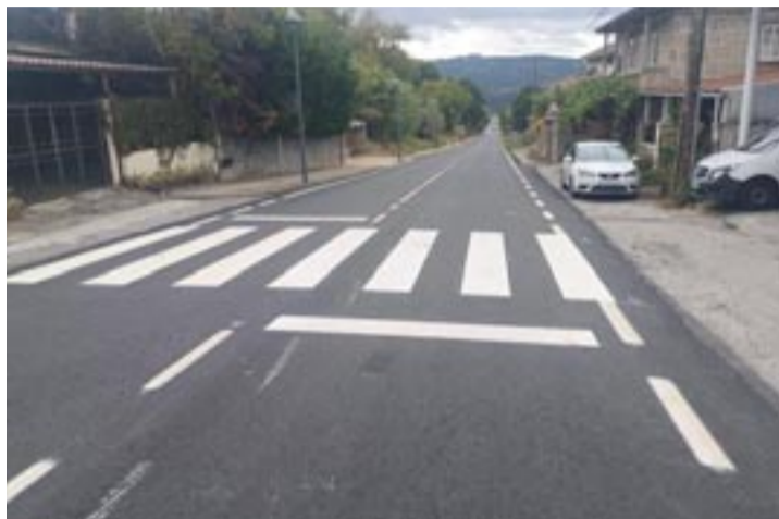
Antigua estrada nacional 120A ao seu paso pola localidade de Mélias.

Tamén se aprobou a axenda urbana e funcional de Ourense SUR, coa planificación de programas dos Concellos de San Cibrao, Pereiro, Barbadás e Ourense para poder acometer infraestruc-