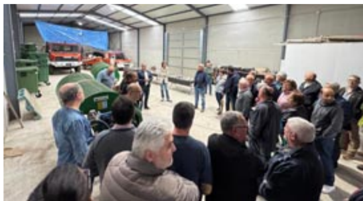
Visita á Sociedade Cooperativa Galega Sofragal de Nogueira de Ramuín.

Participaron máis dun centenar de profesionais, entre produtores de castaña, propietarios individuais ou agrupacións propietarias de soutos en Galicia e representantes de empresas privadas e