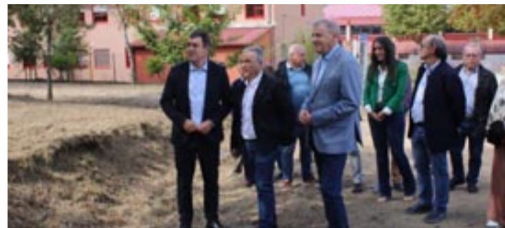
Conseleiro e alcalde visitando a parcela para a construción do instituto.