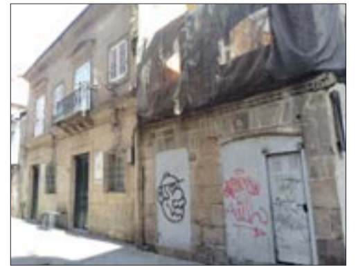
Museo Municipal e a Casa das Cadeas.

Incidíu en que sería imprescindible o desenvolvemento de programas conxuntos con universidades e centros de investigación para fomentar o estudo e profundar na historia local, fortalecendo así o vínculo entre o edificio e a comunidade académica e potenciando o seu papel como referente cultural. "E para garantir a calidade e o atractivo das exposicións entendemos relevante a colaboración permanente con historiadores, arqueólogos e expertos en museografía, que colaborarían no deseño dos contidos –combinando rigorosidade académica con elemen-