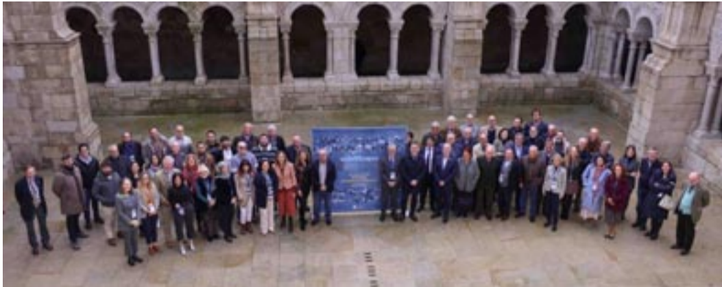
A Ribeira Sacra reuniu unha trintena de expertos de todo o mundo no congreso internacional de 2023.

Fontes" será o nome do congreso internacional que se celebrará os días 27, 28 e 29 de outubro no parador de Santo Estevo (Nogueira de Ramuín), o mesmo escenario no que o pasado ano se organizou un primeiro encontro internacional con expertos sobre paisaxes culturais da auga coa fin de darlle o respaldo e un importante impulso á candidatura da Ribeira Sacra a Patrimonio Mundial.