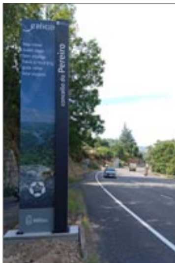
Sinalización turística na estrada OU-536.

Por outra banda, rematou unha nova fase de sinalización turística coa instalación de totems de información turística adaptados aos requerimentos da dirección xeral de Turismo da Xunta nos principais