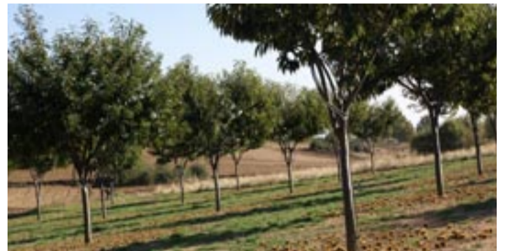
Castiñeiros de froito.

Actualmente, segundo datos achegados pola Rede Estatal do Castaño, en España hai unha superficie de 300.000 hectáreas con esas árbores. En Galicia hai preto de 50.000 hectáreas de castiñeiro e os soutos abarcan unha superficie de case 27.000 hectáreas. A súa presenza é maioritaria no interior e nas montañas de Ourense e Lugo, cunha produción duns vinte millóns de quilos. Estes produtos están amparados pola Indicación Xeográfica Protexida Castaña de Galicia, garantindo un selo de calidade.