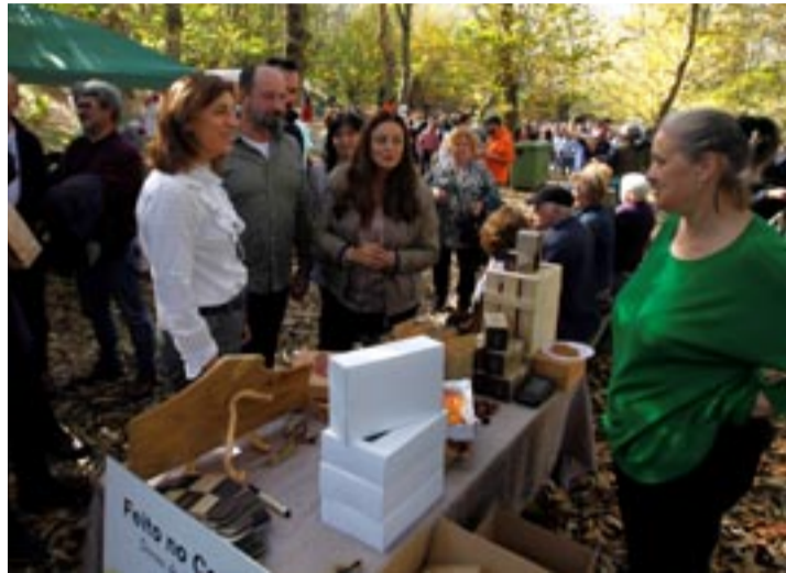
Festa da castaña en Folgoso do Courel.

As provincias de Lugo e Ourense son as máis produtoras de castañas e onde se celebran máis magostos. En diferentes localidades da provincia ourensá comezaron a celebrarse as festas da castaña o sábado día dous e continuarán ata fin de mes. En Riós organizaron a XXIX Festa da Castaña e do Cogomelo. Alí puxeron en valor estes produtos alimentarios, que son referentes na tempada de outono, e a importancia do desenvolvemento do Plan Estratéxico do Castiñeiro para seguir potenciando a produción de castaña. A festa contou cunha variada programación de actividades, entre as que