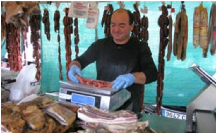
Os produtos do porco son claves nos magostos.

O Montederramo o magosto será o sábado 16 na nave municipal. O menú custa 15 euros por persoa e inclúe empanada, lacón asado, birls preñados, bica, castañas, viño, auga e refrescos. Estará amenizada por Charanga Tat-