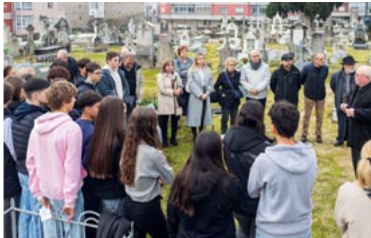
Homenaxe o día 2 de decembro no Cemiterio de San Francisco.