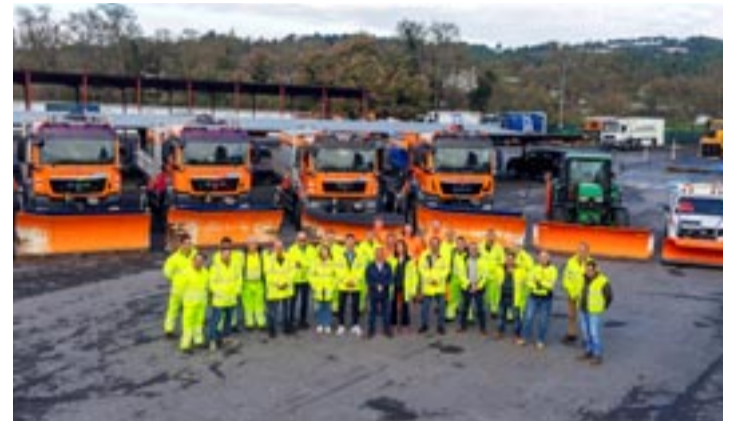
O parque de maquinaria está no polígono de San Cibrao das Viñas.

No parque provincial de maquinaria prepárase o operativo do Plan de Vialidade Invernal, que cunha dotación de preto de medio cento de profesionais, unha vintena de vehículos e unha reserva de 1.850 toneladas de sal ten por obxectivo manter a seguridade nos 1.000 quilómetros de vías provinciais onde hai risco de neve e xeo.