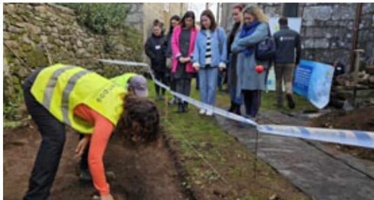
1936. A hipótese de identificación coa que se traballa sinala que alí poden estar enterrados os restos de cinco veciños de Moaña.

Comezaron os traballos de exhumación no cemiterio de Cabreira coa presenza das Alcaldesas e concelleiras de Moaña e Salvaterra. A investigación histórica previa, elaborada dende o grupo HISTAGRA, coa colaboración da Comisión pola recuperación da Memoria Histórica do Baixo Miño, Condado e Louriña e outros investigadores locais, apunta o enterramento de cinco persoas, nun principio, descoñecidas, na fosa de Cabreira, tras ser paseados o 18 de outubro de