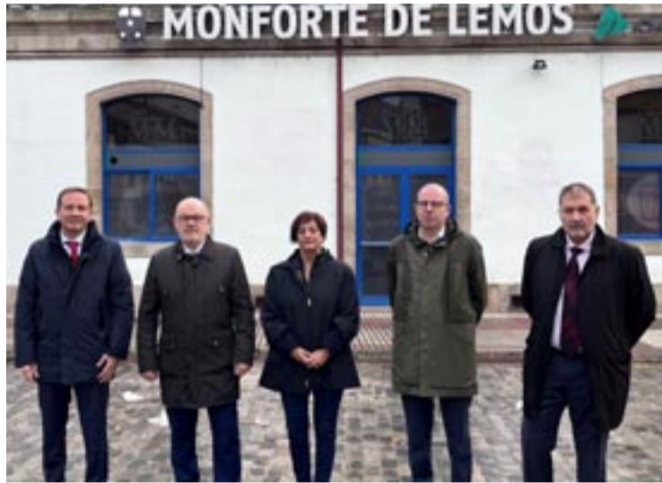
Participantes na viaxe inaugural de Ourense a Monforte.