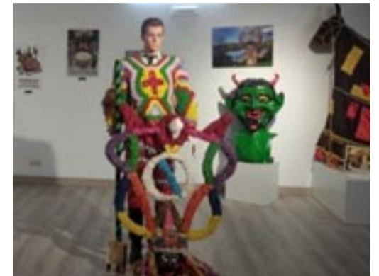
Mostra do entroido na sala de exposicións do Concello vianés.

Amais dos elementos principais da celebración como a comparsa,