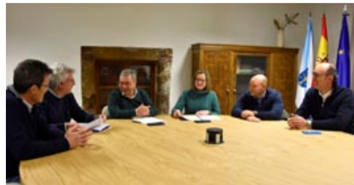
Os colectivos pensan en organizar o Día da Lousa.