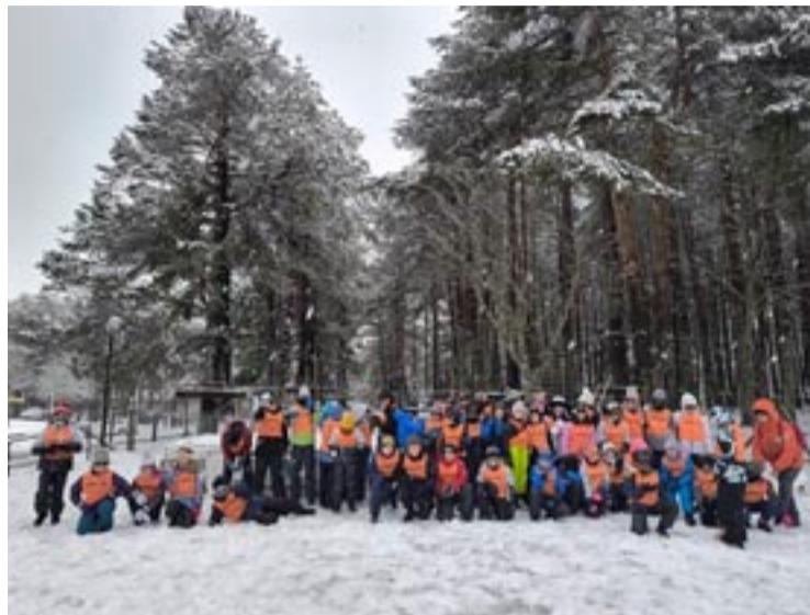
O programa rematará a finais do mes de marzo.

O programa EsquiOU reforzou este ano a súa aposta, superando por primeira vez a barreira das mil prazas (1.050), cubríndose